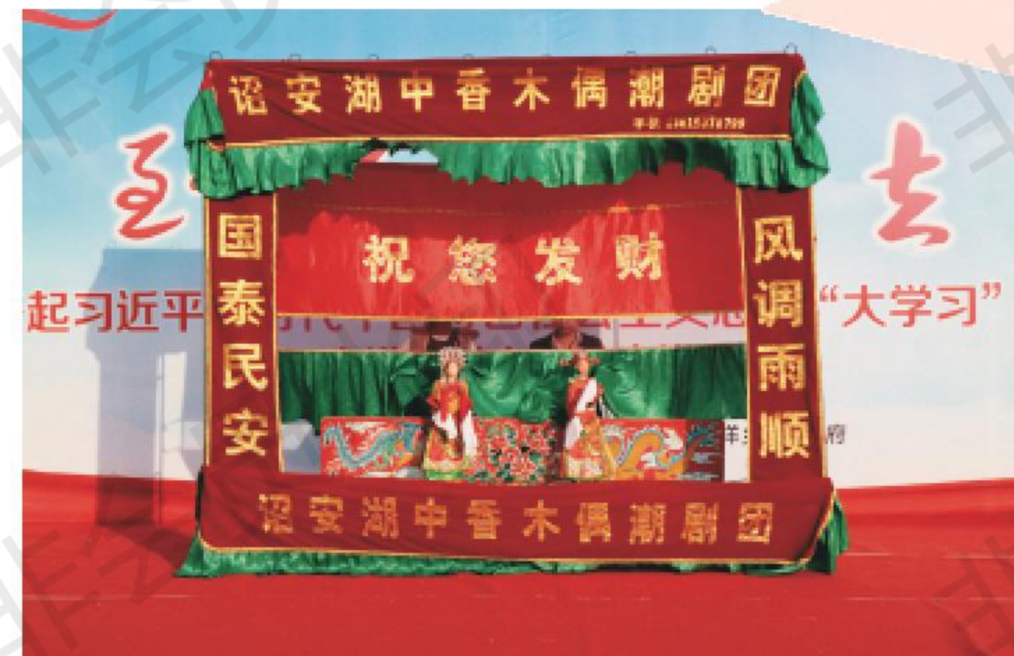
铁枝木偶戏《京城会》