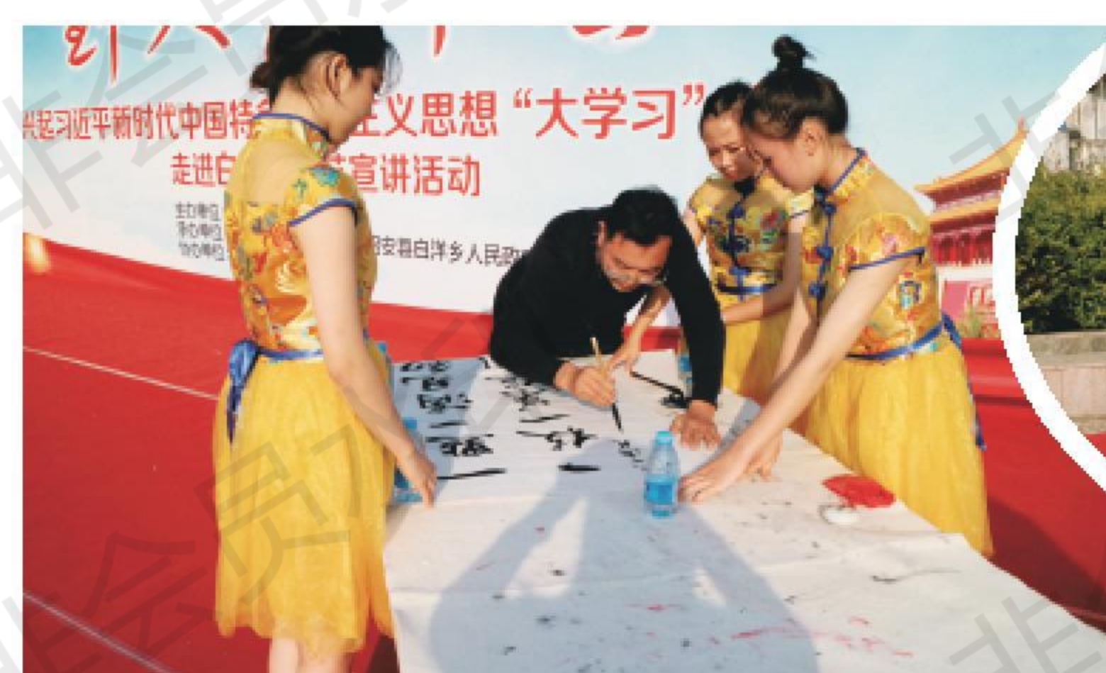
综合节目《一枝一叶总关情》