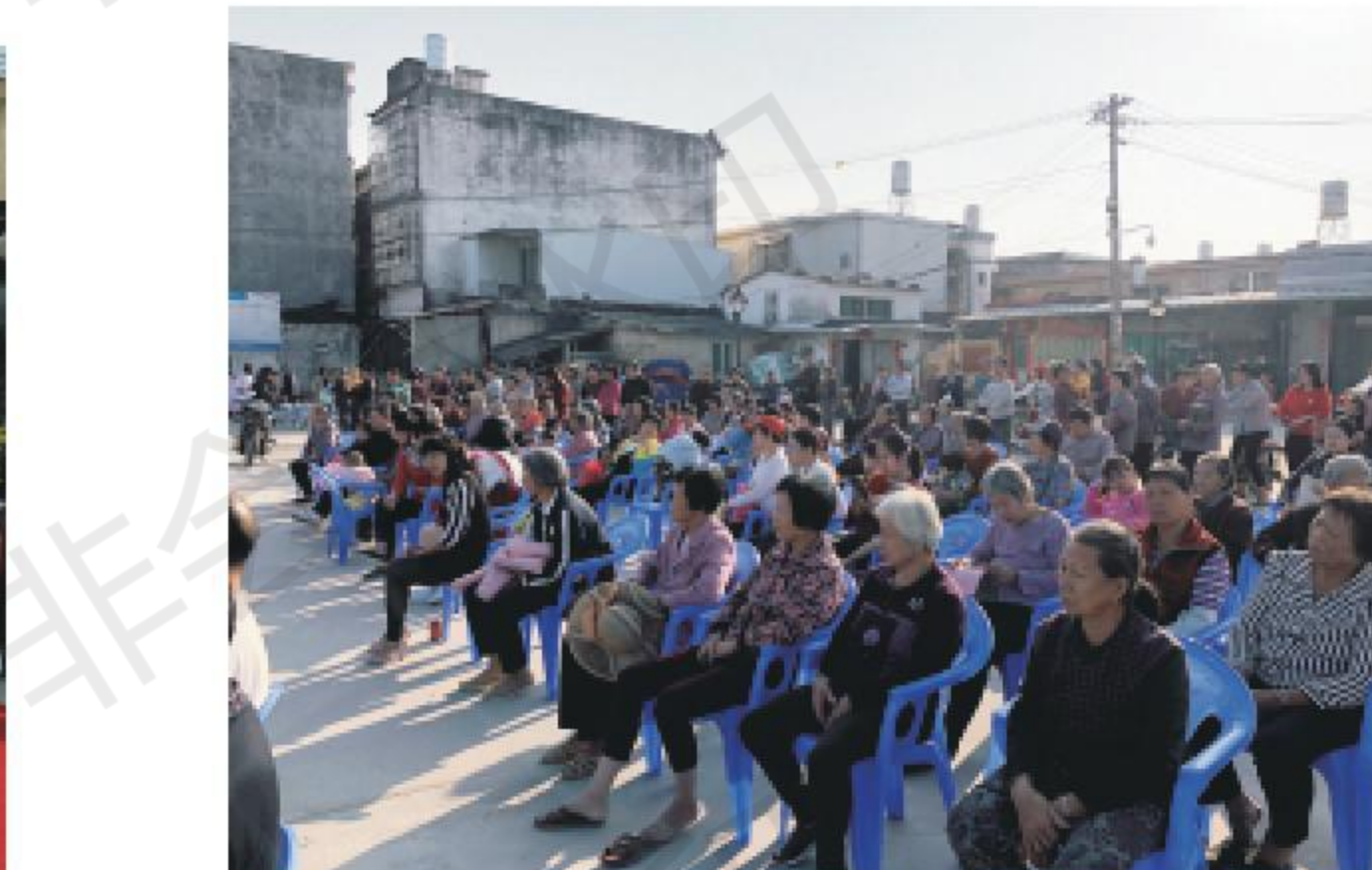
干部群众观看现场