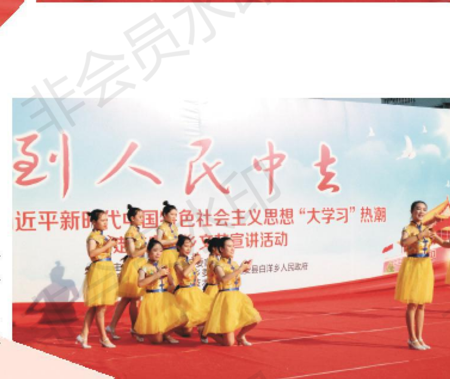
音舞快板《富美新诏安》