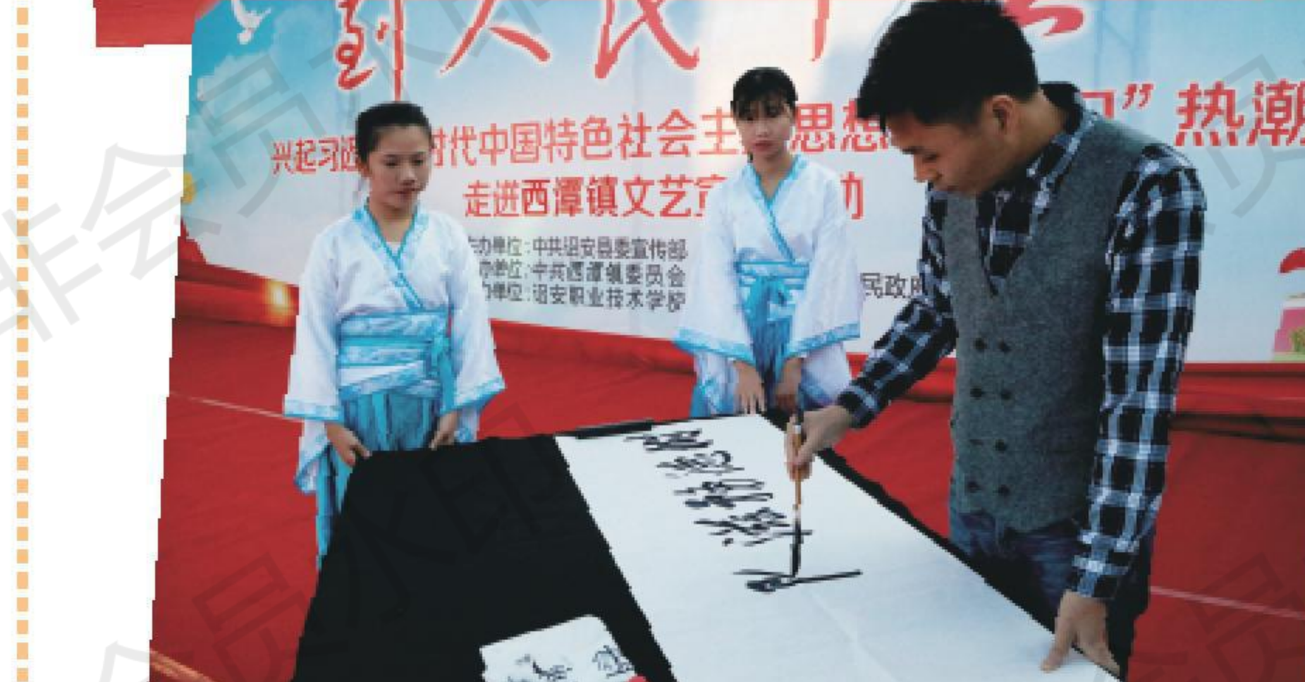
扫黑除恶综合节目《树德务滋 除恶务尽》