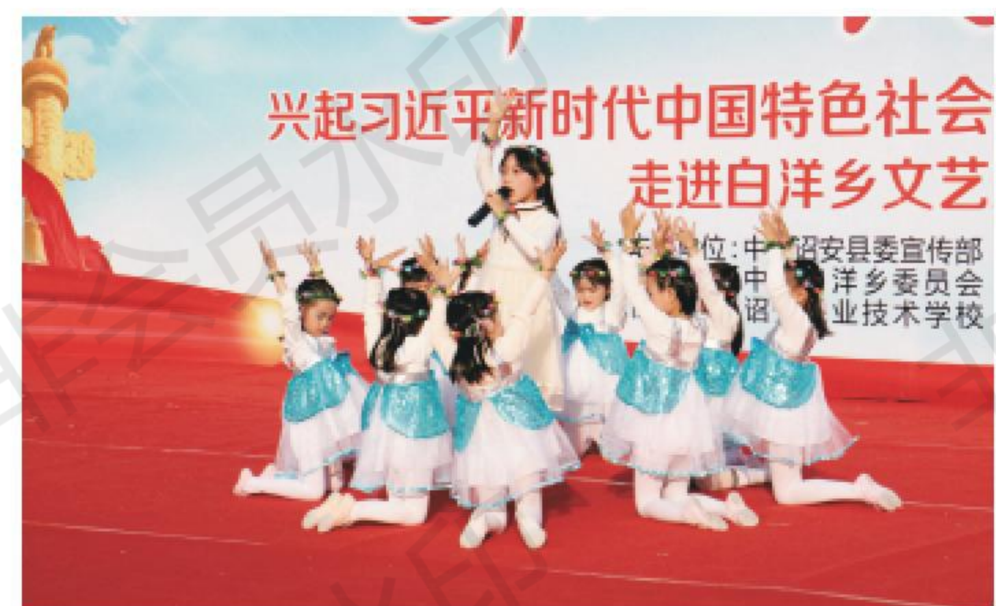
少儿舞蹈《童心飞扬，圆梦中国》